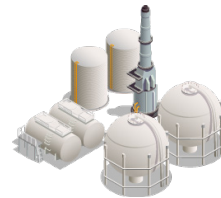
คลังก๊าซปิโตรเลียมเหลว

ลาดหลุมแก้ว บางแค บ้านแฮด รังสิต บางนา เมืองชลบุรี พัทลุง พิจิตร